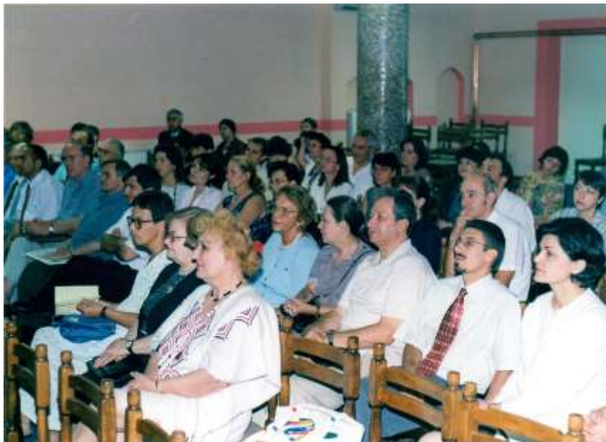
Дел од учесниците на XIV симпозиум, последниот одржан во традиционалниот термин – 7-8 јули и во охридскиот хотел „Палас“, во 2000 год.