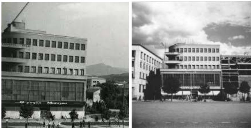
Зградата на плоштадот во Скопје каде што биле сместени просториите на Институтот за фолклор до 1974 год.

раснува во посебен оддел, и 4. Отсек за народна архитектура, кој наскоро е укинат. Вториот оддел бил Одделот за народна книжевност, кој во 1953 год. се одвоил и од него се формирал Институтот за македонски јазик и литература, за повторно овој оддел да биде возобновен во 1964 год. како Оддел за народна литература. Третиот оддел бил Музиколошко-кореографскиот, кој исто така низ децениите што следуваат претрпувал разни наменувања. Во 1955 год. следува нова реорганизација и во Институтот постојат следниве три оддели: 1. Оддел за народно текстилно творештво (подоцна во 1964 год. преименуван во Оддел за текстилна народна орнаментика, а од 1977 год. во Оддел за народна орнаментика), 2. Оддел за народни обичаи и игри и 3. Музиколошко-кореографски оддел, кој подоцна во 1969 год. се преименува во Оддел за народна музика и народни ора. Во 1961 год. Одделот за народни обичаи и игри се преименувал во Оддел за народна книжевност, обичаи и игри, а по возобновувањето на Одделот за народна литература во 1964 год. и поради кадровското осипување на Одделот за народни обичаи и игри, единствениот етнолог што останал во него, организационо бил приклучен кон Одделот за народна литература.