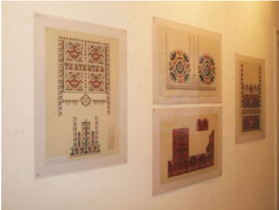
Дел од експонатите на изложбите со везови на Институтот за фолклор