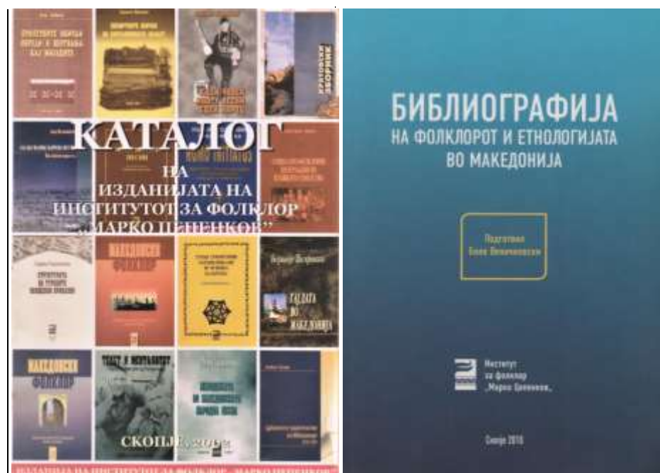
Каталогот на изданијата на ИФМЦ (до 2002 год.) и најсеопфатната книга со библиографијата за фолклорот и етнологијата во Македонија.