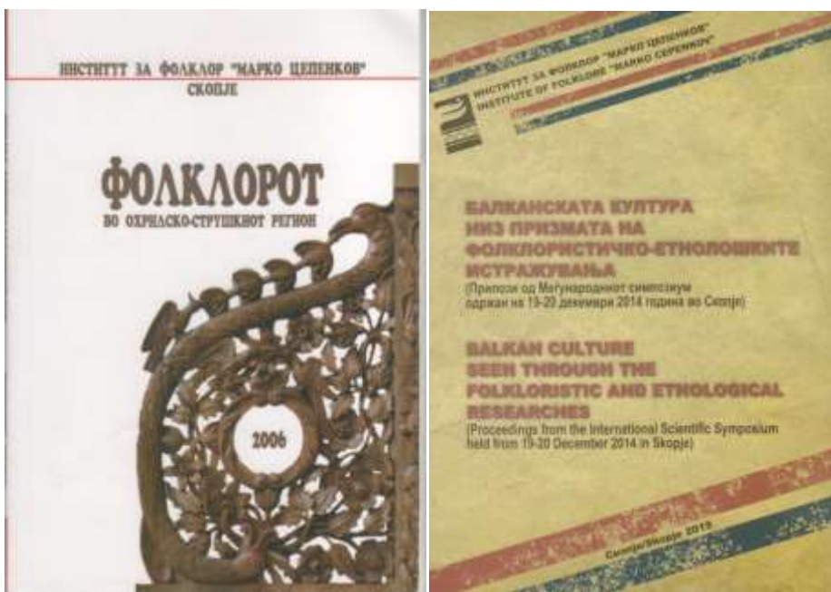
Наградената книга „Фолклорот во Охридско-струшкиот регион“ и зборникот на трудови од Меѓународниот научен симпозиум одржан во 2014 год.