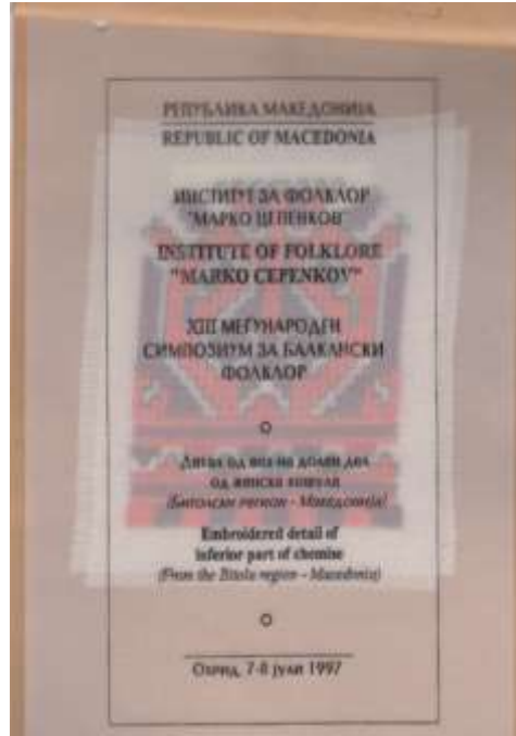
Подарок за учесниците на XIII симпозиум одржан во 1997 година