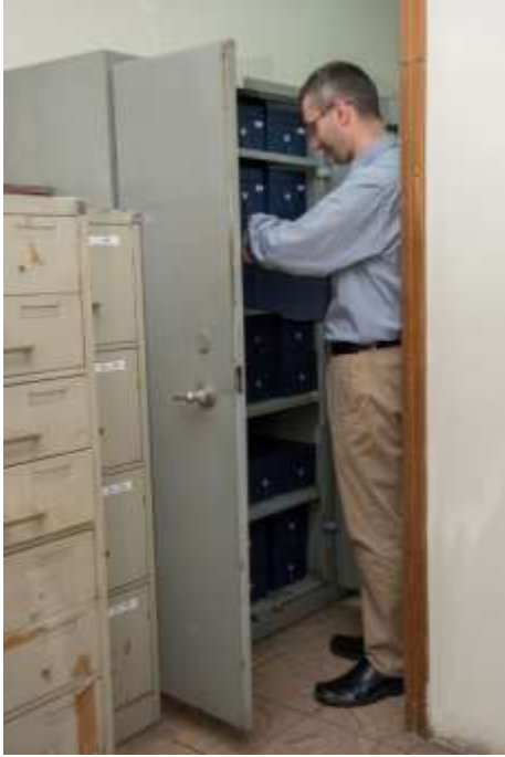
Дел од фонотечниот архивски материјал Цане Серафимовски, архивист