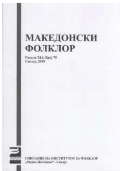
Првиот и еден од последните броеви на „Македонски фолклор“.