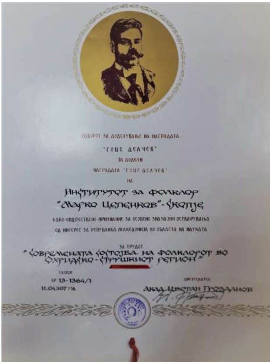
Институтот за фолклор добитник на високата државна награда „Гоце Делчев“ за 2007 год.