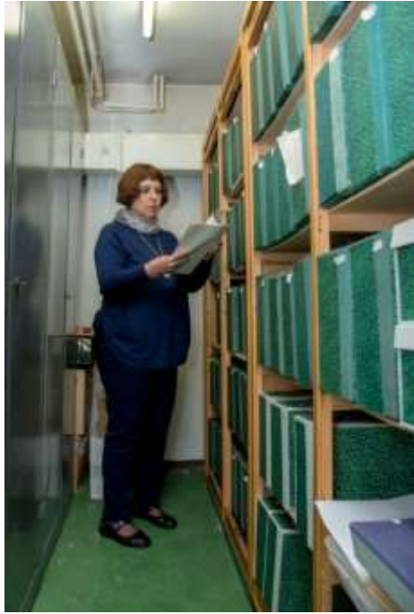
Дел од архивската граѓа Блага Ангелкова, архивист