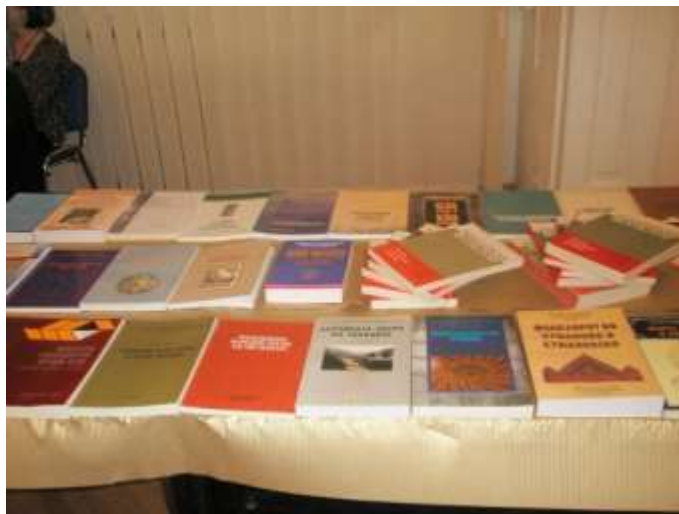
Дел од изданијата на Институтот за фолклор

Несомнено е значајно кога се зборува за издавачката дејност да се истакне дека освен вработените во Институтот за фолклор објавуваат и голем број на надворешни соработници, што укажува на отвореноста на издавачката дејност не само кон нови личности кои ќе се презентираат пред јавноста со своите истражувања, туку и кон нови идеи и согледби кои се однесуваат на фолклорот.