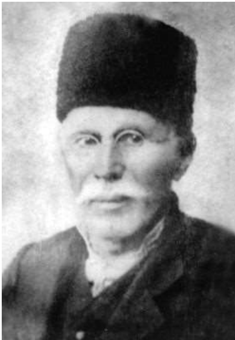
Патронот на Институтот за фолклор, фолклористот Марко Цепенков