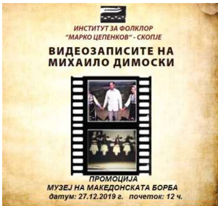
Од активностите на Институтот за фолклор: промоција на видеозаписите на преранопочинатиот етнокореолог Михаило Димоски