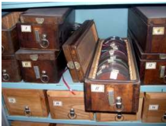
Дел од фонотечниот архив на Институтот за фолклор

ријал е снимен на над 4.000 магнетофонски ленти и касети, сместени во соодветни дрвени кутии, кои пак се чуваат во специјални метални плакари. За секоја снимена аудио-лента постои и соодветна содржинска листа, а во најголем дел материјалот од овие аудио-ленти е и дешифриран, т.е. е преточен во текст отчукан на машина за пишување. 2 Аудио-материјалот со музички фолклор, покрај тоа што е дешифриран, во добар дел е и мелографиран, односно за вокалните, вокално-инструменталните и инструменталните изведби постои и нотен запис. Фонотечните материјали на Архивот на Институтот за фолклор се заштитени и со законска регулатива (ex-lege). Скромниот фонд на видео-материјали од 60-тина видео-ленти се чува на видео-записи, кој во поголем дел за жал е без звучен запис, односно припаѓа на т.н. „неми филмови“. Овие видеозаписи воглавно се со етноко-реолошки материјали, односно е со снимен материјал со изведба на народни ора, а делумно се и со етнолошки материјал, односно со извршување на одредени обреди. Во последниве години, следејќи ги современите технолошки процеси, во институтскиот архив е отворен и фонд со материјали снимени на компакт-дискови, односно е формирана и цедетека.