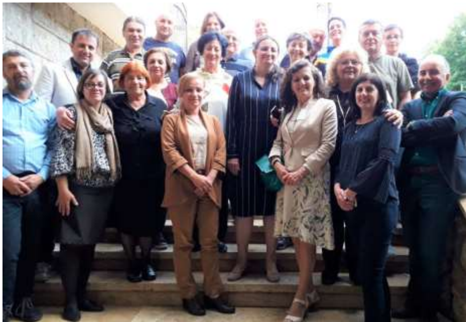
Дел од учесниците на симпозиумот одржан во организација на Институтот за фолклор и Македонското етнолошко друштво, хотел „Кратис“, Кратово, 2019 год.