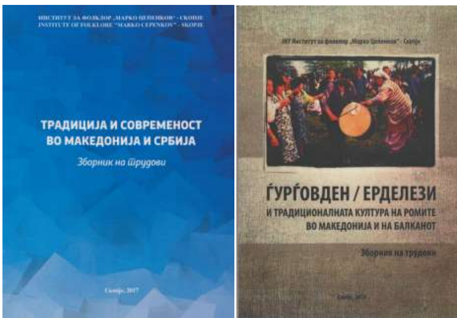
Зборници на трудови од меѓународни научни собири во издание на Институтот за фолклор