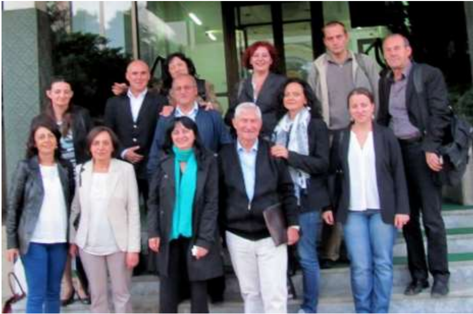
Учесниците во билатералниот проект во организација на МАНУ и БАН по научната конференција во МАНУ, Скопје, септември 2016 год.