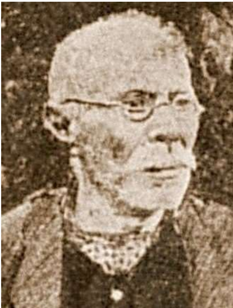
Ликот на Марко Цепенков како еден од препознатливите заштитни знаци на Институтот за фолклор