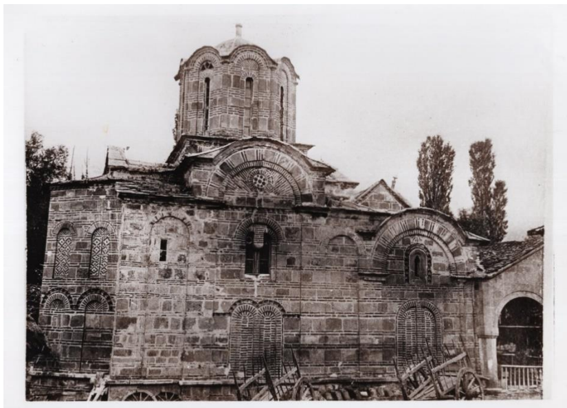
Сл. 5: „Св. Димитрија – Марков манастир“, Скопско. Фотографија бр. Q 265/24