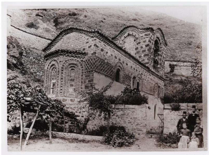
Сл. 9: „Св. Димитрија“ во Велес. Фотографија бр. Q 266/41, Архив на ЈНУ Институт за фолклор „Марко Цепенков“ – Скопје