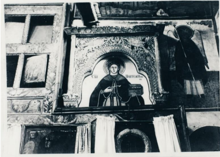
Сл. 4: „Св. Пантелејмон“ во с. Нерези, Скопско. Фотографија бр. Q 265/10, Архив на ЈНУ Институт за фолклор „Марко Цепенков“ – Скопје