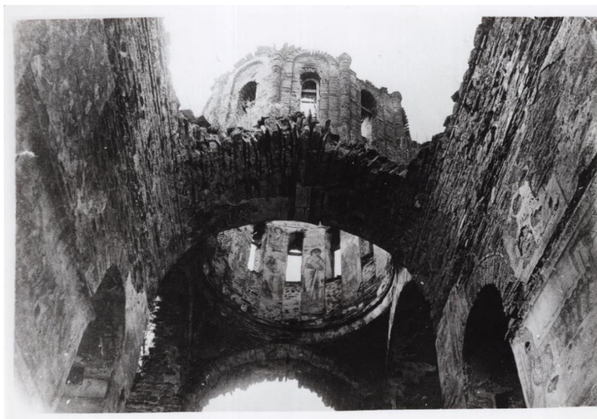
Сл. 6: „Успение на Пресвета Богородица“ во с. Матејче, Кумановско. Фотографија бр. Q 266/11, Архив на ЈНУ Институт за фолклор „Марко Цепенков“ – Скопје