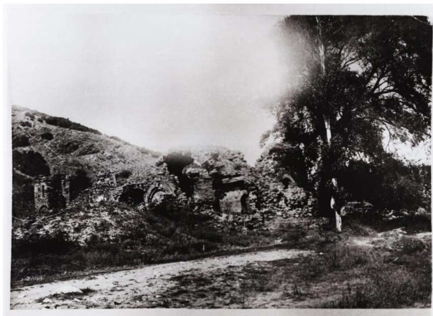
Сл. 7: „Св. Леонтиј“ во с. Водоча, Струмичко. Фотографија бр. Q 266/30