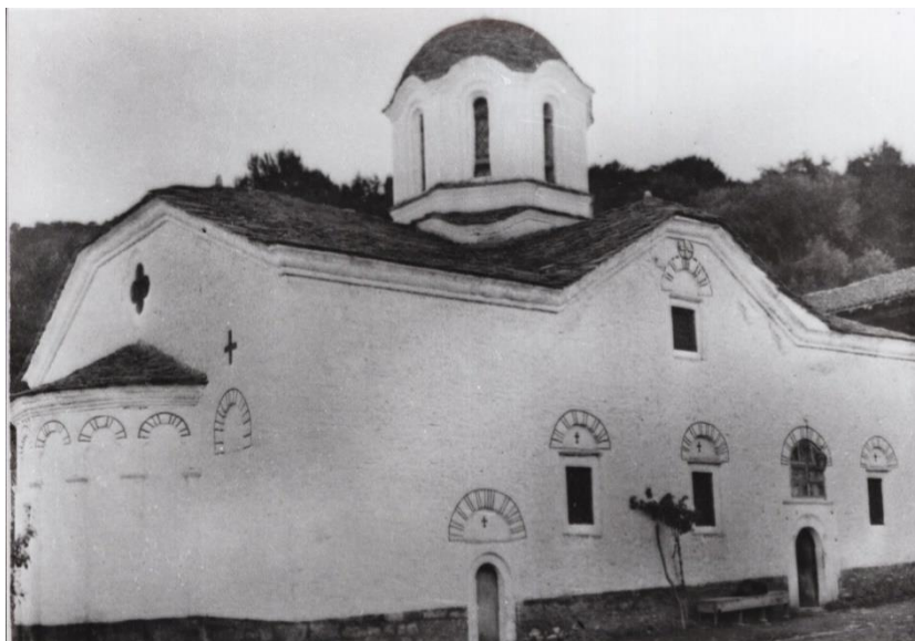
Сл. 10: „Св. Преображение“/„Св. Сотир – Буковски манастир“, с. Буково, Битолско. Фотографија бр. Q 267/34, Архив на ЈНУ Институт за фолклор „Марко Цепенков“ – Скопје