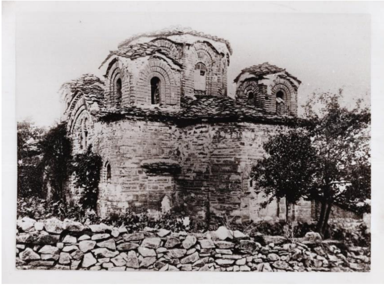
Сл. 3: „Св. Пантелејмон“ во с. Нерези, Скопско. Фотографија бр. Q 265/5, Архив на ЈНУ Институт за фолклор „Марко Цепенков“ – Скопје