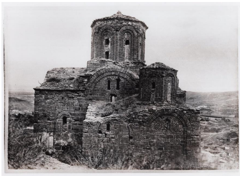
Сл. 8: „Св. Архангел Михаил“ во Штип. Фотографија бр. Q 266/35, Архив на ЈНУ Институт за фолклор „Марко Цепенков“ – Скопје