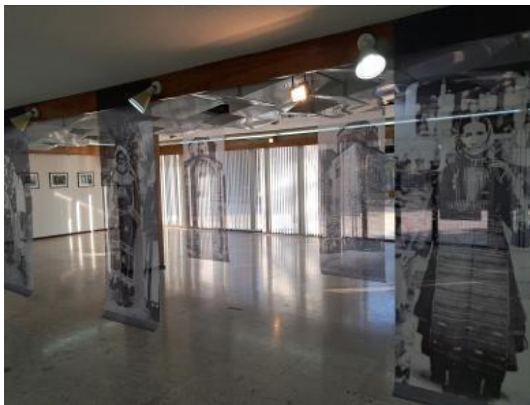
Сл. 5: Поглед кон дел од изложбената поставка „Македонија во 1900 година. Фотографии од научната експедиција на Никодим Павлович Кондаков“, поставена во Ликовниот салон на МАНУ