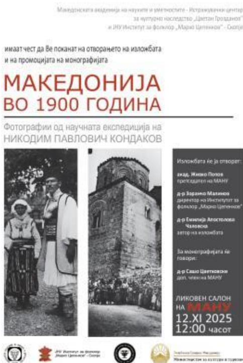
Сл. 1: Покана за изложбата „Македонија во 1900 година. Фотографии од научната експедиција на Никодим Павлович Кондаков“