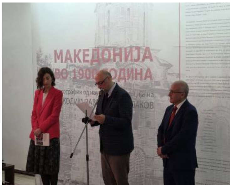
Сл. 2: Од отворањето на изложбата „Македонија во 1900 година. Фотографии од научната експедиција на Никодим Павлович Кондаков“, поставена во Ликовниот салон на МАНУ