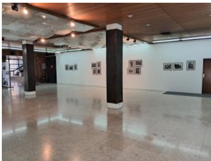
Сл. 3: Дел од изложбената поставка „Македонија во 1900 година. Фотографии од научната експедиција на Никодим Павлович Кондаков“, поставена во Ликовниот салон на МАНУ