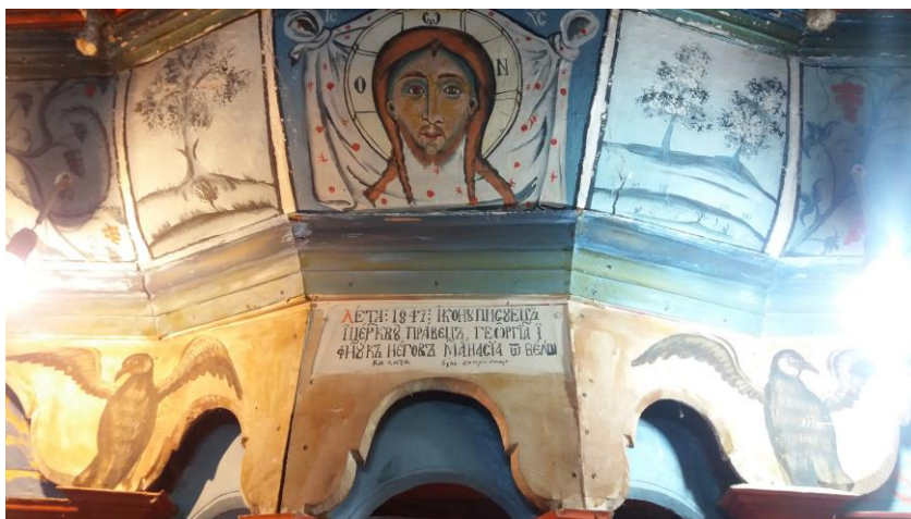
Сл. 4: Натпис на иконостасот на црквата „Св. Спас“ во с. Кожле, Скопско.