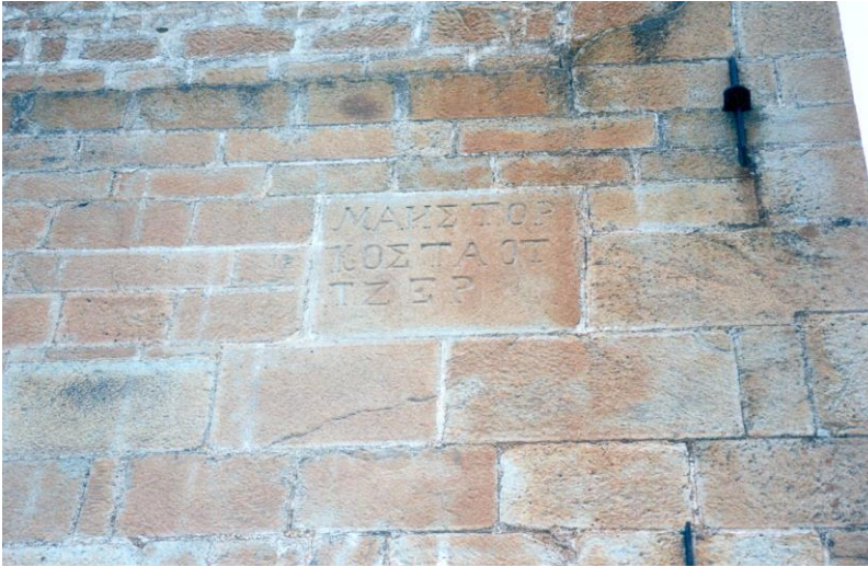
Сл. 1: Натпис на мајстор Коста од Цер, издлабен во блок од камен, вграден на фасадата на црквата „Св. Преображение“ во с. Гопеш, Битолско.