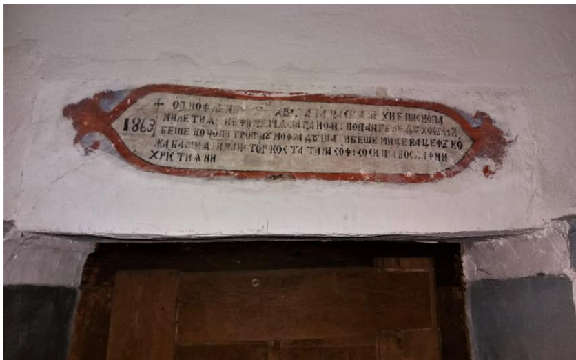
Сл. 3: Ктиторскиот натпис над влезната врата во наосот на црквата „Св. Атанасие“ во с. Цер, Демирхисарско.